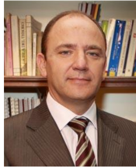
Xavier Castellà Castellà Auditors Consultors

C/ Laureá Miró 191, Entl. 08950- Esplugues de Llobregat Tel.: 93 371 25 90 auditors@castella-bcn.com www.acastella-bcn.com